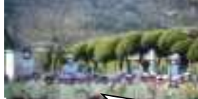
いってらっしゃい!