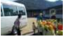
スクールバスに乗って出発!