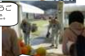
よろしくお願いします。