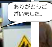
ありがとうございました。