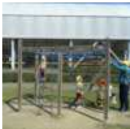
アスレチックや滑り台もしました。