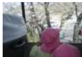
にこにこ園の桜の花が見えてきたのでそろそろ到着です。

1年で足取りがしっかりし、元気いっぱい交通公園で遊んで帰ることができました。とても楽しかったようで帰りには「またくる〜!」と話していた子ども達です。