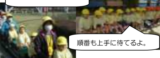
先生と一緒に出発!