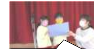
これからにこにこ園クイズを始めます。