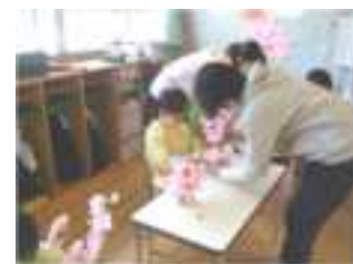
先生と一緒にフラワーアレンジメントをしました。