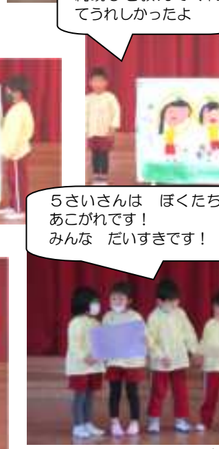
5さいさんは ほくたち わたしたちのあこがれです！みんな だいすきです！