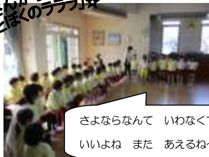
さよならなんて いわなくていいよね また あえるね〜♪

0歳児～4歳児と職員みんなで作った手形の桜は、5歳児さんへの感謝の気持ちのメッセージ入りです。本荘にこにこ園での楽しかった思い出がいっぱいですね♪にこにこ園のリーダーとしてみんなをリードしてくれた5歳児さん。本当にありがとうございました。みんなと過ごした日々はとても楽しかったです。