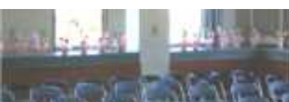
式場がアレンジメントの花でいっぱいになりました。

できあがった「フラワーアレンジメント」を見て子ども達は「かわいい」「見て〜」と自分の作品に満足していました。その花に囲まれて幸せいっぱいの式場になりました。