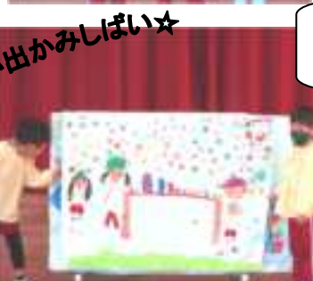
運動会で5歳児さんのかっこいいところをたくさんみつけたよ！