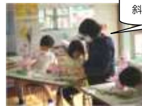
真剣に聴いていました。