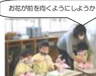
どのくらいの長さにしようか考えて切ったり、生ける向きを考えたしながらそれぞれ思い思いの作品になりました。