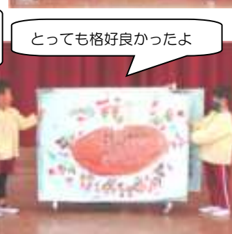
とっても格好良かったよ