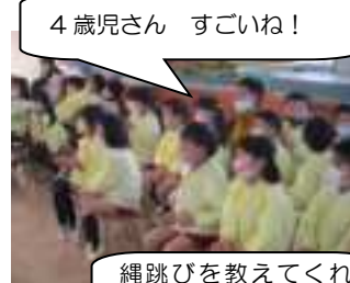
4歳児さん すごいね！