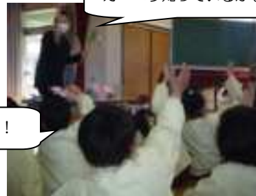
ガーベラ知っているかな？