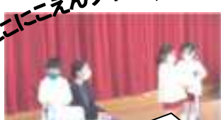
にこにこ園で一番小さいクラスは何組でしょうか？