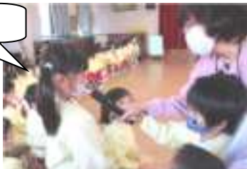
他にもたくさんにこにこ園に関するクイズがたくさんありました。

今日の「ありがとうさようならの会」の進行と出し物は「4歳児さん」です。プログラムに沿って順調に会を進めてくれました。