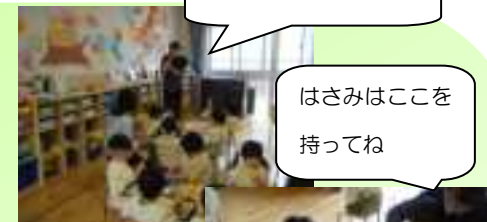
はさみはここを持ってね