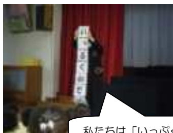
私たちは「いっぱい do」です。

自己紹介もパタパタと字が変わりユニーク！ どういう仕組みになっているのだろう？ 子ども達の眼差しは真剣！