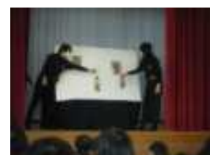
ぴったりの帽子があるかな？