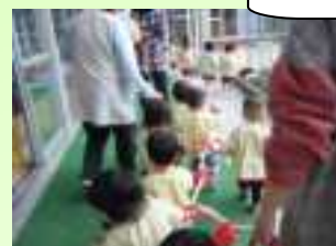
もも組さんは、お散歩ロープを持ったり、避難車に乗って園内を散歩したりしています。