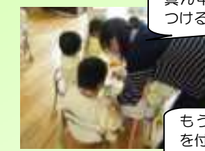
はさみで切ったり、のりを付けたりしてたんぼほを作りました。