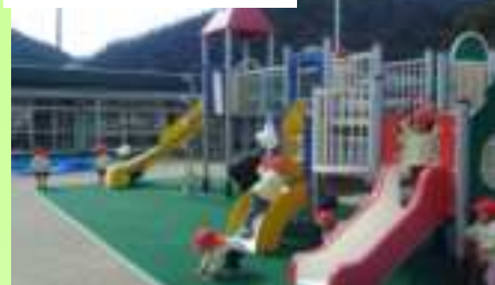
総合遊具や乗り物でしっかり体を動かして遊んでいます！