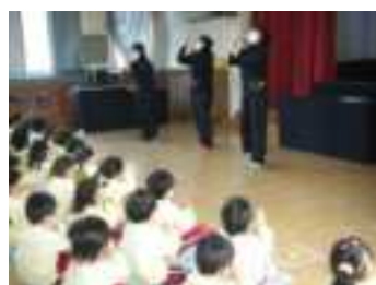
春の歌メドレーです。