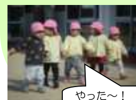
やった〜！何して遊ぼうかな？