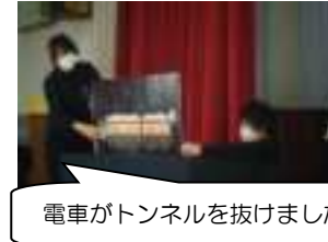
電車がトンネルを抜けました。