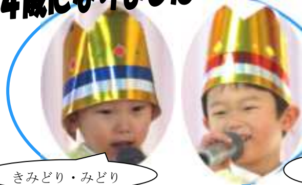
きみどり・みどり