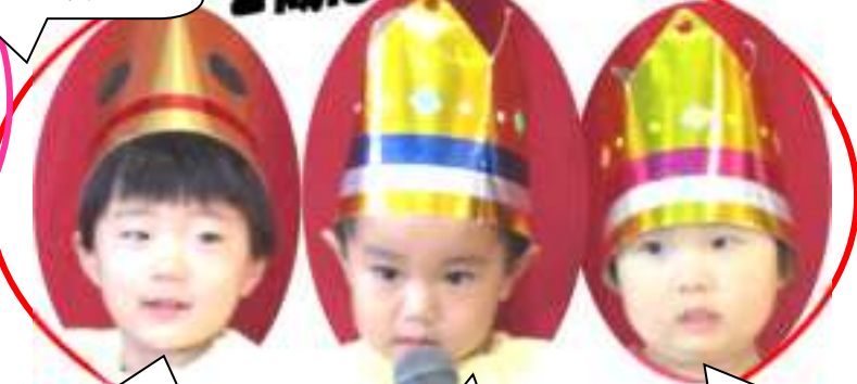
なんでもだいすき