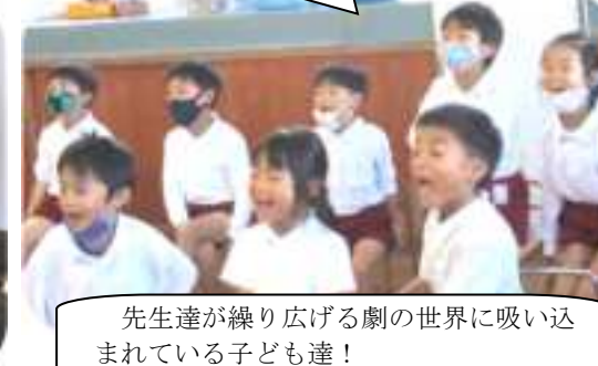
先生達が繰り広げる劇の世界に吸い込まれている子ども達！

とれたかぼちゃでクッキング！誕生日をお祝いするかぼちゃのプリンができました！この日の給食にはかぼちゃのプリンが！誕生日会の余韻を楽しみながらの給食となりました。