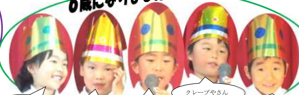
にこにこえんのせんせい