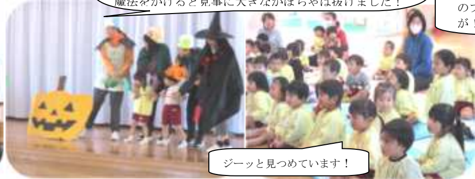
ジューッと見つめています！

3上は、手遊び「やきいもグーチーパー」で園近先生とジャンケン勝負！「やった！勝ったあ〜！」「あー！負けた〜！」と会場がグリーンと盛り上がったところで誕生日会がスタートしました。